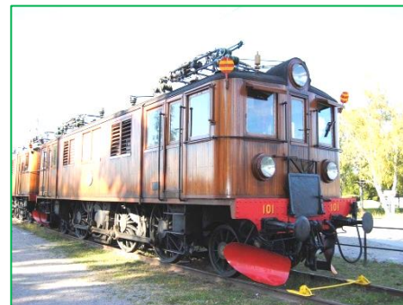
Bild på D101